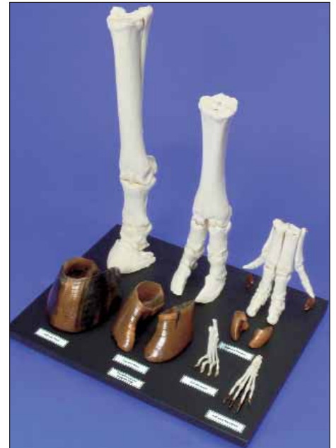
210.202 Fußskelettypen, vom Sohlengänger bis zum einhufigen Spitzengänger: Kaninchen, Katze, Schwein, Rind, Pferd. Zusammen auf Brett montiert + Arbeitsfolie.