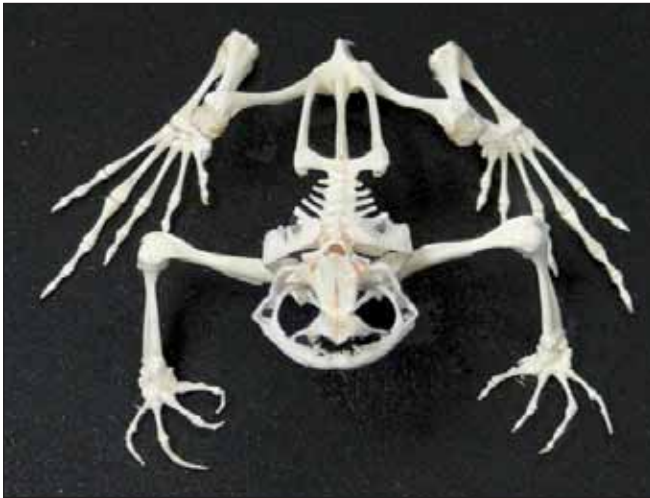
210.151 Frosch mit Glashaube ausländisch, nicht geschützte Art