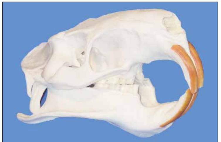
210.182 Schädel Biberratte (Nutria) Schädellänge ca. 10-12 cm, Länge Nagerzähne ca. 3-4 cm